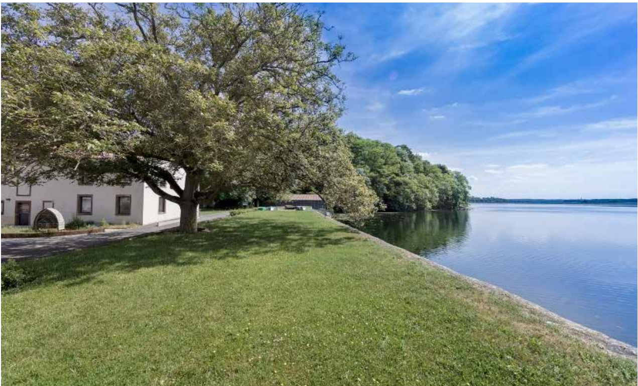
Résidence Lindre-Basse, CAC - la synagogue de Delme, 2017.