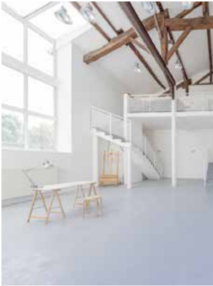
Vue de l'atelier