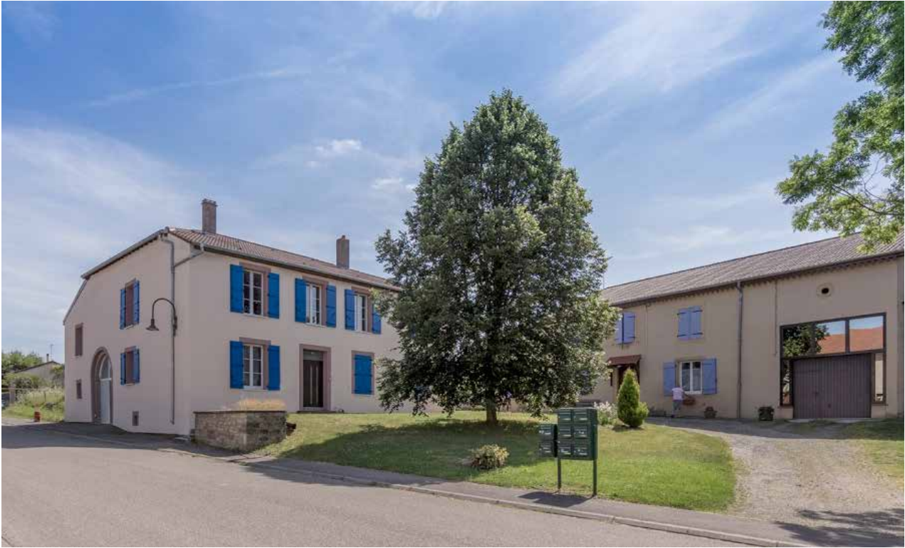
Résidence Lindre-Basse, CAC - la synagogue de Delme, 2017.