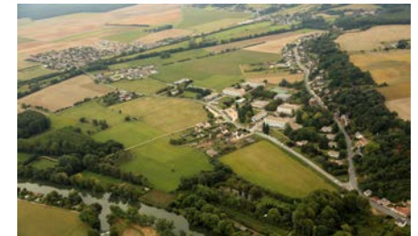
Lycée agricole de Vendôme