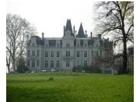
Lycée agricole de Tours Fondettes