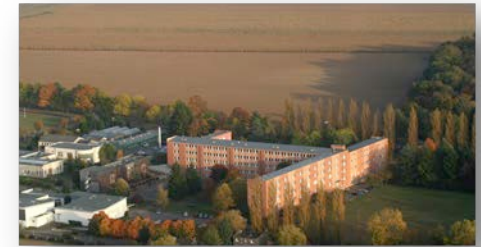
Lycée agricole de Chartres

La somme de 3500 € servira à financer les matériaux pour la production de l'œuvre, la diffusion /communication autour du projet. Les frais de déplacement sont gérés par l'établissement d'accueil et plafonnés à 500€. Ce dernier prend en charge l'hébergement, la restauration (sur site) et certains frais annexes (tél, courrier,..)